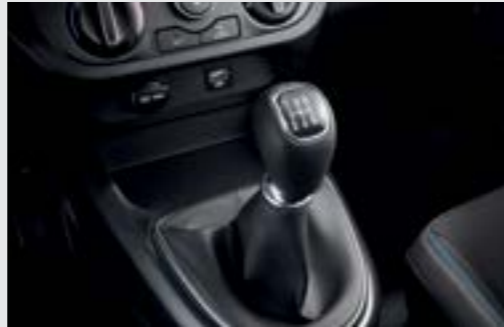
Hộp số sàn 5 cấp Mang đến khả năng vận hành bền bỉ và tiết kiệm nhiên liệu