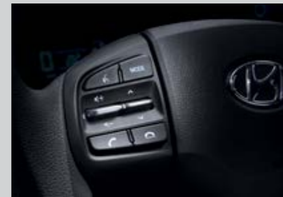
Cụm điều chỉnh media tích hợp nhận diện giọng nói