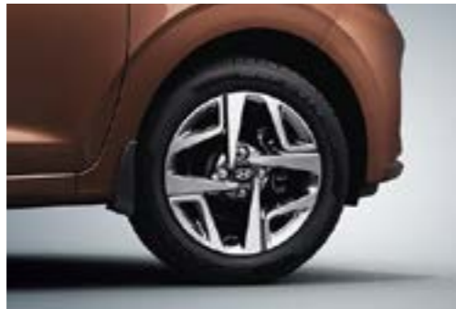
Vành hợp kim 15 inch cao cấp tạo hình trẻ trung