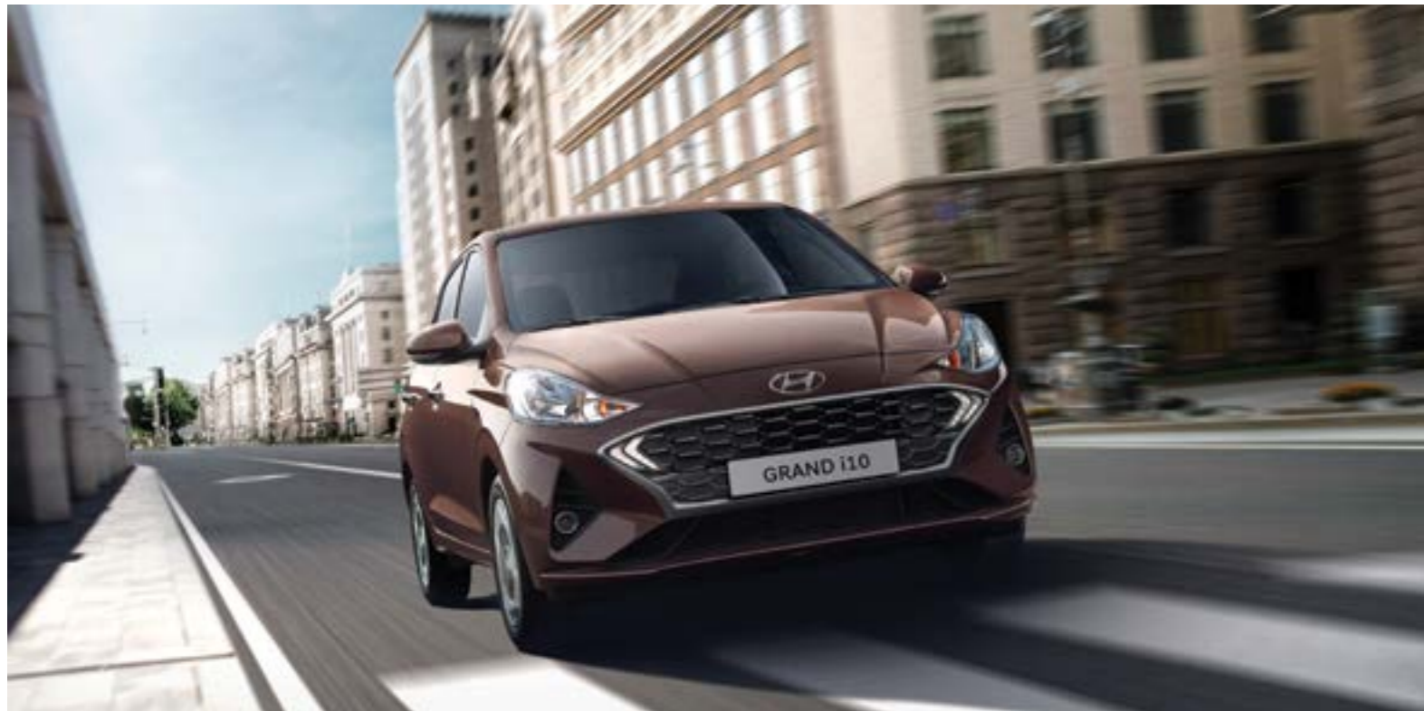
Cụm lưới tản nhiệt đan hình lục giác cùng với đường dập nổi trên mũi xe và dọc thân xe tạo nên nét trẻ trung