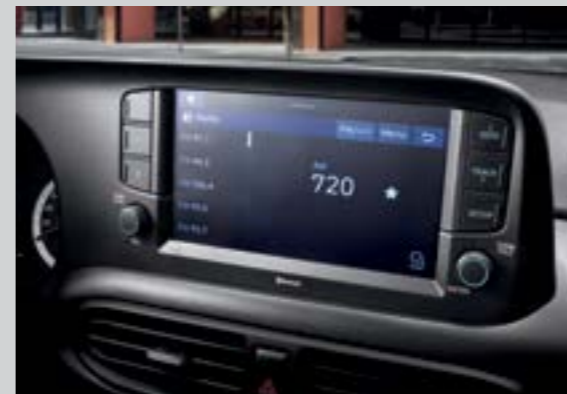
Màn hình giải trí 8 inch

All New Grand i10 sedan sẽ mang đến cho bạn sự rộng rãi đầy bất ngờ. Không chỉ rộng rãi All New Grand i10 sedan còn mang đến sự tiện nghi giúp hành khách tận hưởng các hành trình.