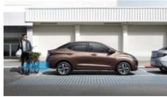
Cảm biến va chạm phía sau