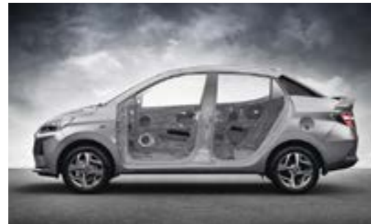
Hệ thống khung mới cứng vững hơn với thép cường độ cao