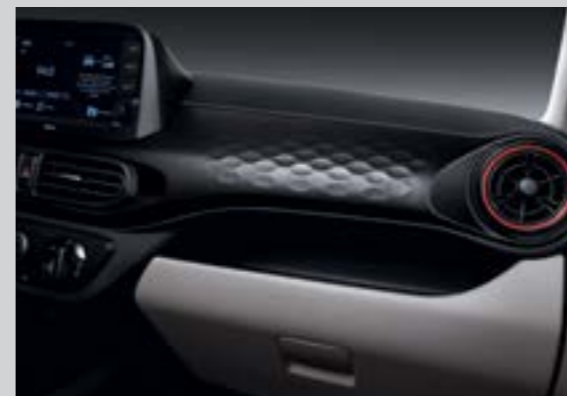
Khay để đồ tiện ích với phần ốp tạo hình 3D ấn tượng