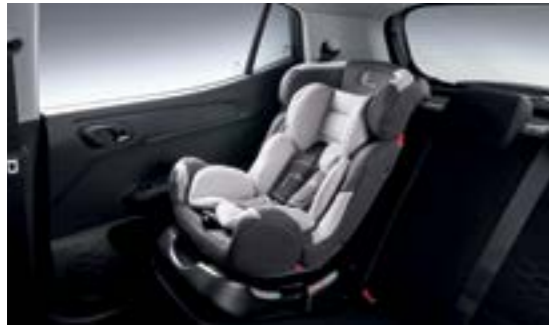
Ghế an toàn trẻ em ISO FIX