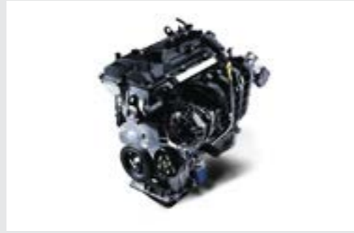
Động cơ Kappa 1.2L mang đến khả năng vận hành êm ái, ổn định cùng với khả năng tiết kiệm nhiên liệu nhưng vẫn đáp ứng được nhu cầu vận hành của khách hàng.