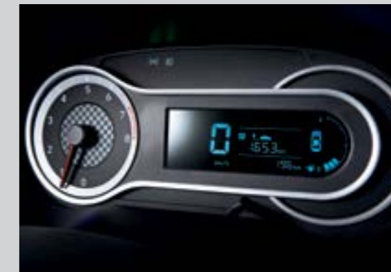
Màn hình thông tin thiết kế thể thao