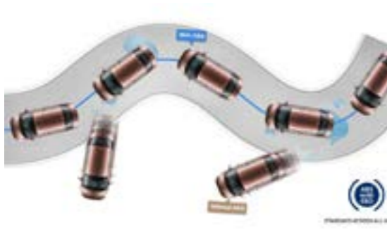
Hệ thống phanh ABS kết hợp EBD