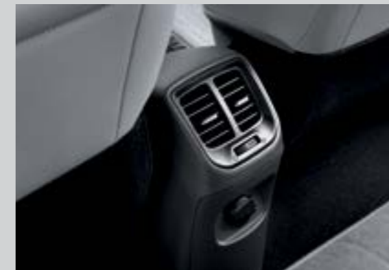
Cửa gió điều hòa hàng ghế thứ 2