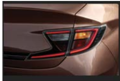
Đèn hậu dạng LED thiết kế cách điệu, đồng bộ với cụm đèn phía trước