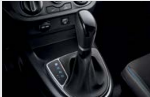
Hộp số tự động 4 cấp Được tối ưu để tạo nên sự cân bằng giữa niềm vui lái xe và khả năng tiết kiệm nhiên liệu