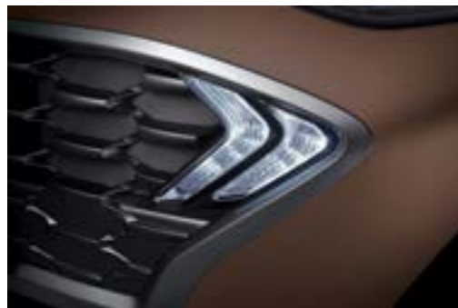
Cụm đèn ban ngày DRL (Daytime Running Light) được thiết kế phá cách dạng boomerang