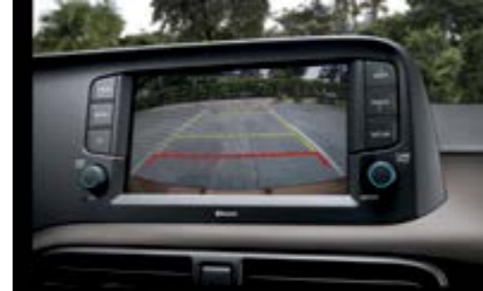
Camera lùi hỗ trợ đỗ xe