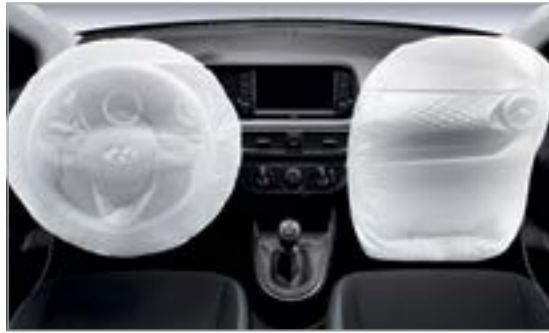
Hệ thống an toàn 2 túi khí